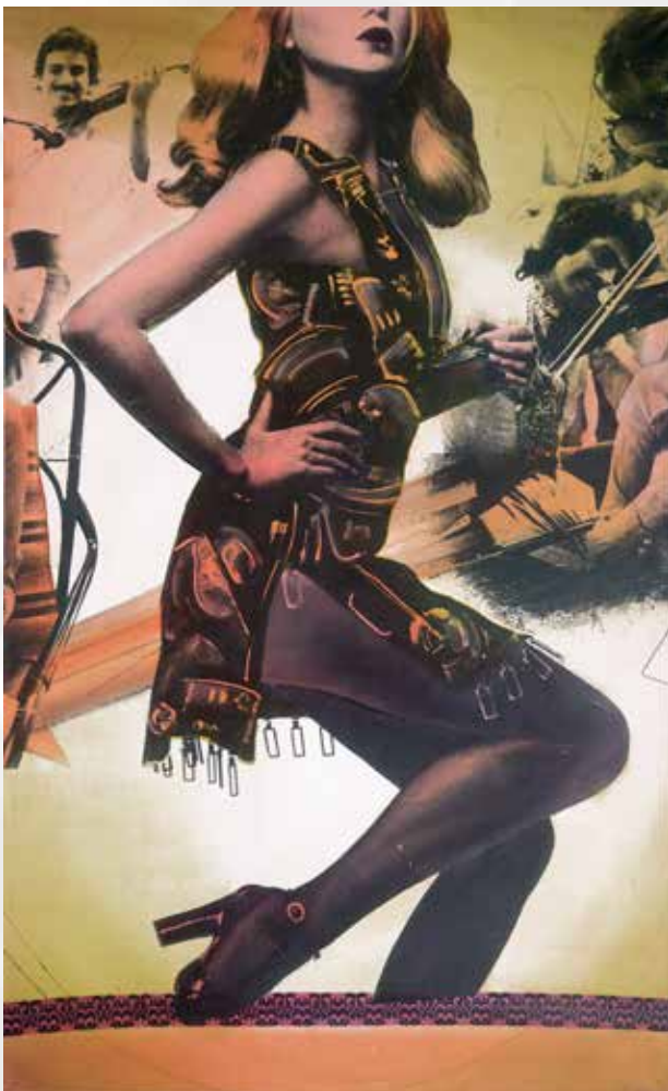
Il Flamenco, 1975

L'esuberanza dell'opera e della personalità di Bertini emerge finalmente in modo completo attraverso una catalogazione che vuole essere anche un modo di confrontarsi con i sapori di un'epoca ancora estremamente attuale, in cui le forme dell'avanguardia e della sperimentazione si coniugano con i processi mediati dall'esterno, dalla società della comunicazione, recepiti e rilette con l'ironia e l'invenzione che la visione aperta e internazionale di Bertini (pienamente inserito nella vita culturale parigina del secondo dopoguerra) ha offerto, sulla base delle sue mai dimenticate radici toscane.