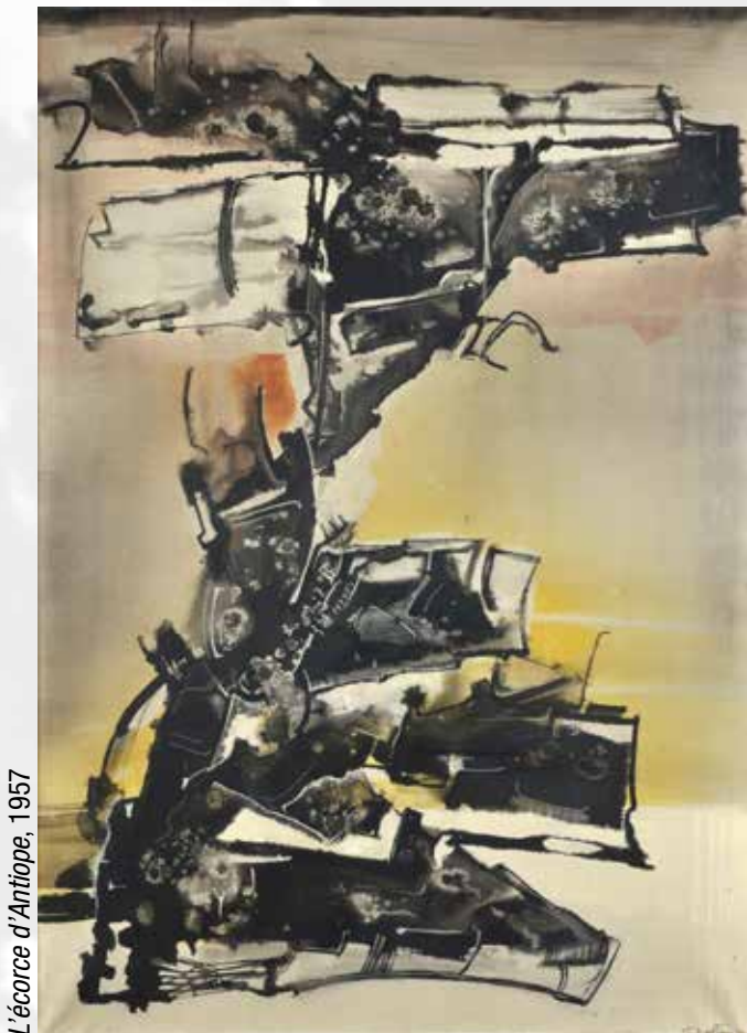
L'écorce d'Antiope, 1957