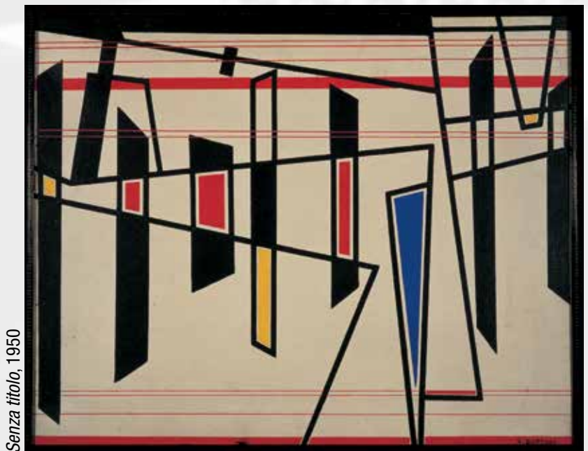
Senza titolo, 1950