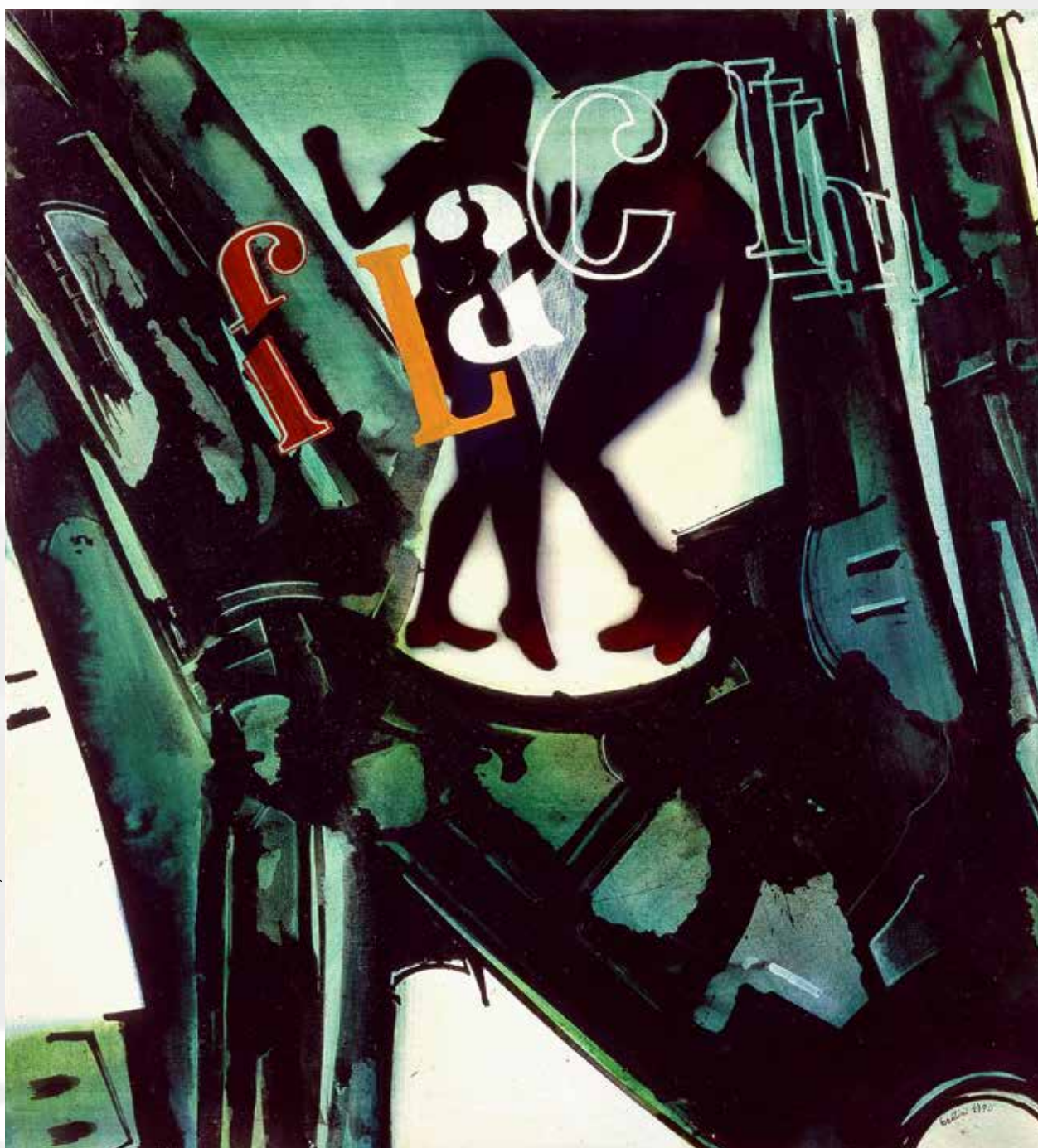
La balia cretese amica di Pericle, 1990

L'exubérance de l'œuvre et de la personnalité de Gianni Bertini est enfin révélée de manière exhaustive grâce à un catalogage qui est aussi une manière de rendre compte des caractéristiques d'une époque encore extrêmement actuelle, où les formes de l'avant-garde et de l'expérimentation se conjuguent avec des processus empruntés à l'extérieur, à la société de la communication, pris en compte et réinterprétés avec l'ironie et l'invention qu'a offertes la vision ouverte et internationale de Gianni Bertini – pleinement intégré dans la vie culturelle parisienne de l'après-guerre –, sur la base de ses origines toscanes qu'il n'a jamais reniées.