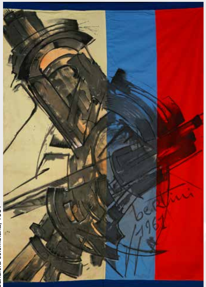
Bandiera colombiana, 1961